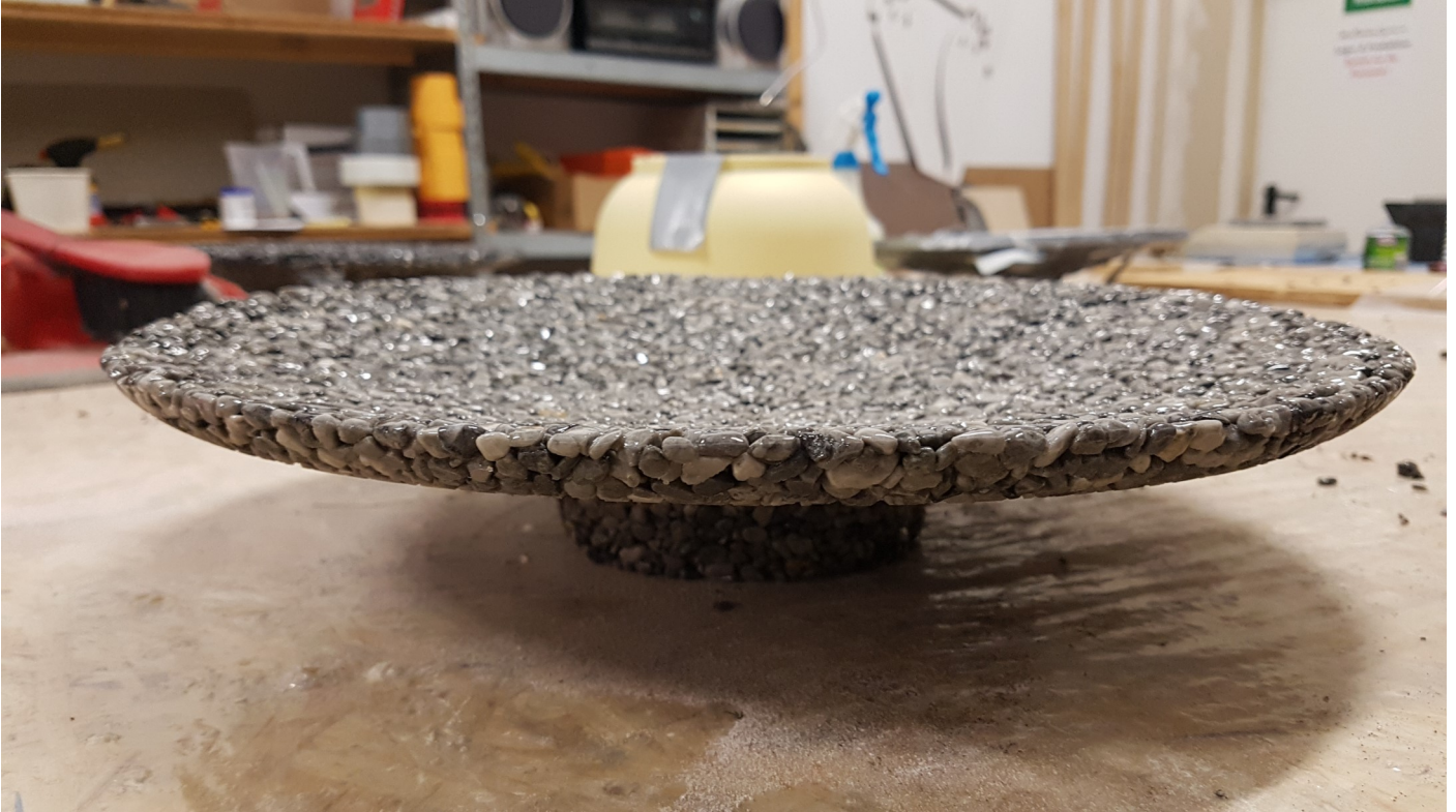
Diese Schale hat einen Durchmesser von 365 mm und eine Höhe von 65 mm

Mit einer runden Suppenschöpfkelle wird geglättet. Nach der Aushärtung wird die Schale geprüft und eventuell noch leicht abgeschliffen und dann noch mit S140 eingestrichen.